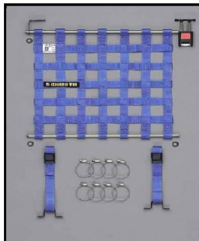
Rede para veículos de 2 Portas, tem a medida de 525 mm x 467 mm.