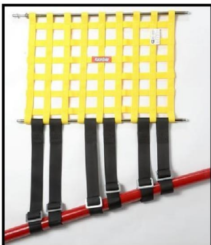
Rede para veículos de 4 Portas, tem a medida de 400 mm x 405 mm.

Rede de Proteção de Janela (Window Net) FIA Approved