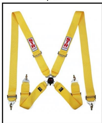
Largura do Cinto: 50mm