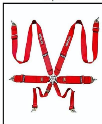
Largura do Cinto: 50mm